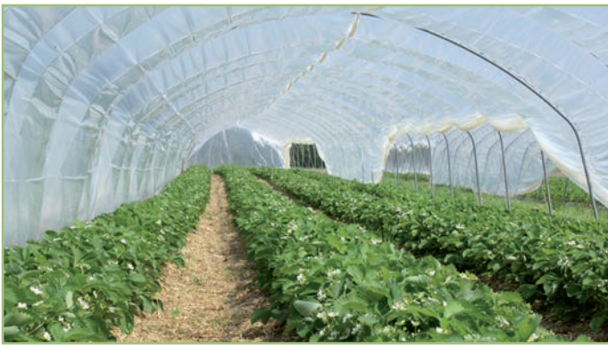
FVG Römertunnel 3,50 – 6,50 m