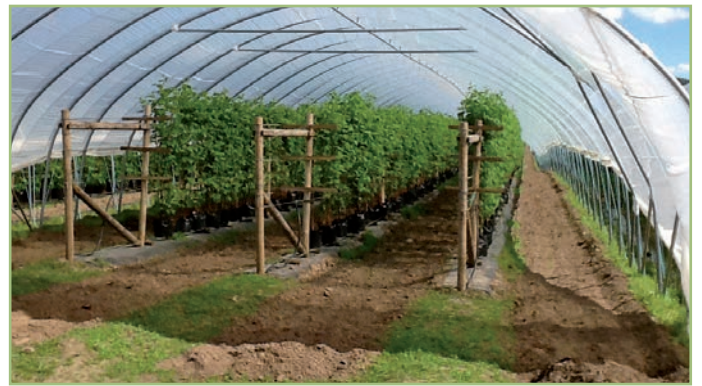
Elite Enviro Tunnel 6,50 – 8,50 m